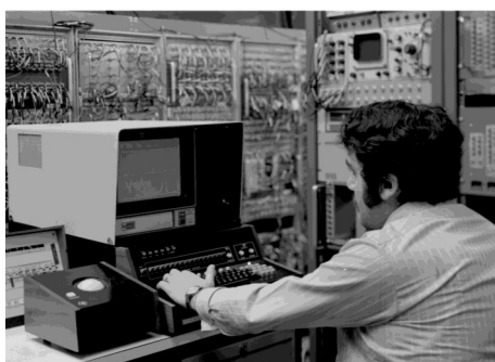
Un salarié attend que son ordinateur démarre

Ce temps n'est pas perdu pour tout le monde : il est rattrapé par les salariés, gracieusement, tous les jours. Ça mérite bien une augmentation !