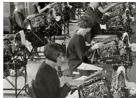
La finance calcule l'EBIT avec les moyens du bord