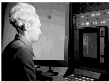
Et Windows 10 sauva le monde