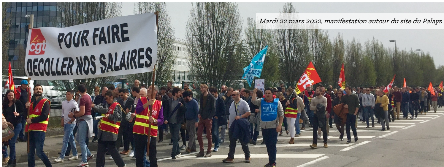
Mardi 22 mars 2022, manifestation autour du site du Palays

Malgré 3 semaines de mobilisation, l'accord de politique salariale 2022/2023 a été signé par la CFE-CGC et FO, au mépris de l'intérêt des salariés. Cette mobilisation historique est à la hauteur de la colère des salariés, confrontés à des conditions de travail de plus en plus difficiles. Venez en discuter avec nous !