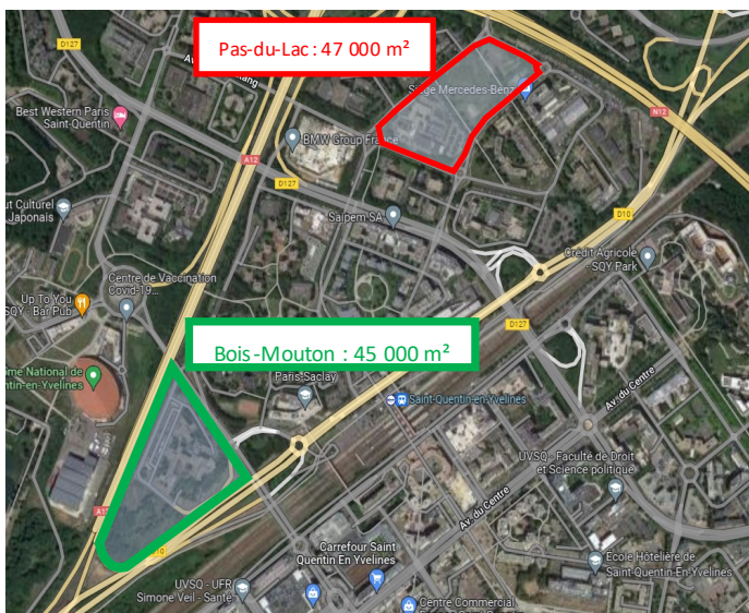
Le site d'Airbus à Elancourt est construit sur un terrain d'environ 100 000 m²

Pour ceux qui n'ont pas encore vu notre communication sur nos panneaux d'affichage : 2 sites sont envisagés près de la gare de Saint Quentin en Yvelines (SQY) => la Direction a pour objectif de faire le choix définitif en juillet 2022.